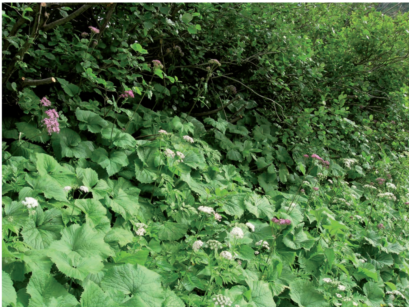
Abb. 2: Der dichte Grünerlen-Unterwuchs lässt kein Licht auf den Boden kommen.

Artikel 104 der Bundesverfassung verpflichtet die Schweiz zur «Erhaltung der natürlichen Lebensgrundlagen und zur